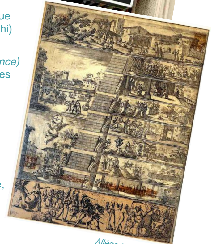
Allégorie du Carême (Valerio Spada, Florence, vers 1650).