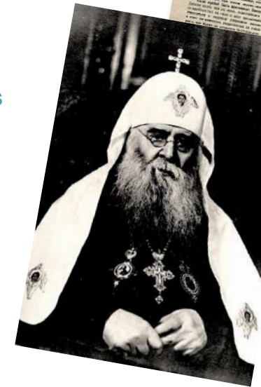
Le patriarche de Moscou Sergueï vers 1943 et sa déclaration de loyauté à l'URSS en 1927.