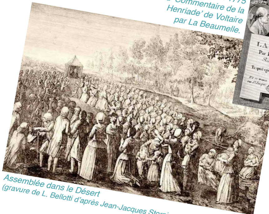
Assemblée dans le Désert (gravure de L. Bellotti d'après Jean-Jacques Storni, 1775).