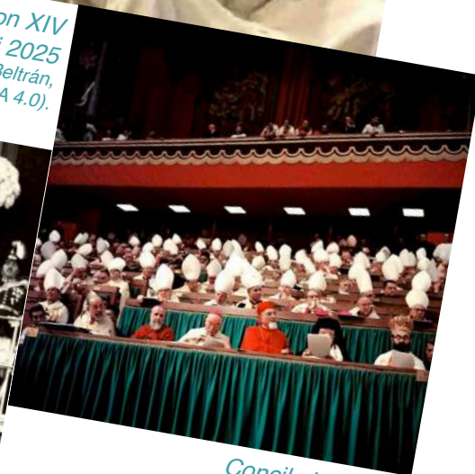
Concile Vatican II.