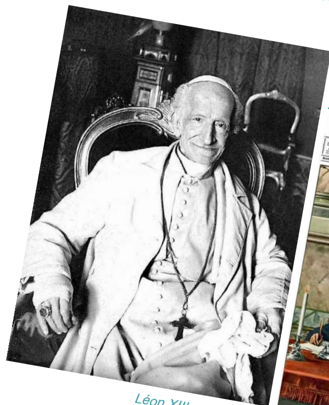
Léon XIII en 1887 (Enrico Cané, L'illustrazione italiana ).

«Un événement historique : au Palais du Latran, le Duce et le Cardinal Gasparri signent l'accord entre l'État italien et le Saint Siège». ( La Domenica del Corriere , 24 février 1929).