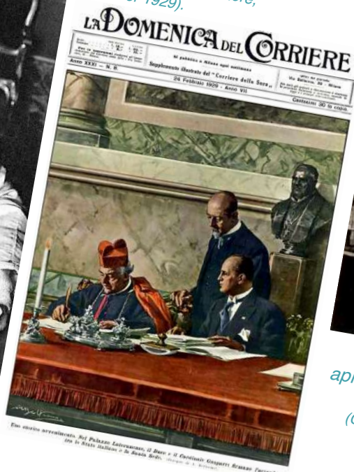
Pie XII bénit le peuple après son couronnement le 12 mars 1939 ( Codex Sinaiticus , 4 e siècle, British Library).

«Un événement historique : au Palais du Latran, le Duce et le Cardinal Gasparri signent l'accord entre l'État italien et le Saint Siège». ( La Domenica del Corriere , 24 février 1929).