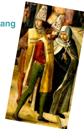
Juifs revêtus d'un sanbenito (détail de 'Saint Dominique présidant un autodafé', Pedro Berruguete, 1493-1499, Prado, Madrid).

À partir du milieu du 15 e siècle, en réaction au succès de l'intégration à la vie commune des chrétiens convertis depuis le judaïsme, les statuts de pureté de sang se sont répandus, de corporation en corporation, d'institution en institution, de ville en ville, en Espagne puis au Portugal. Avec l'approbation tacite des monarques, ces dispositifs visaient à écarter les chrétiens d'origine juive, sous le prétexte que leur sang était porteur de la faute ineffaçable d'avoir persisté au long des siècles à ne pas reconnaître la divinité de Jésus. L'étude de ce phénomène permet de montrer, de façon concrète, que s'il est impossible de distinguer de façon nette l'antijudaïsme et l'antisémitisme, c'est bien parce que les domaines de la politique et de la religion n'étaient alors pas dissociables.