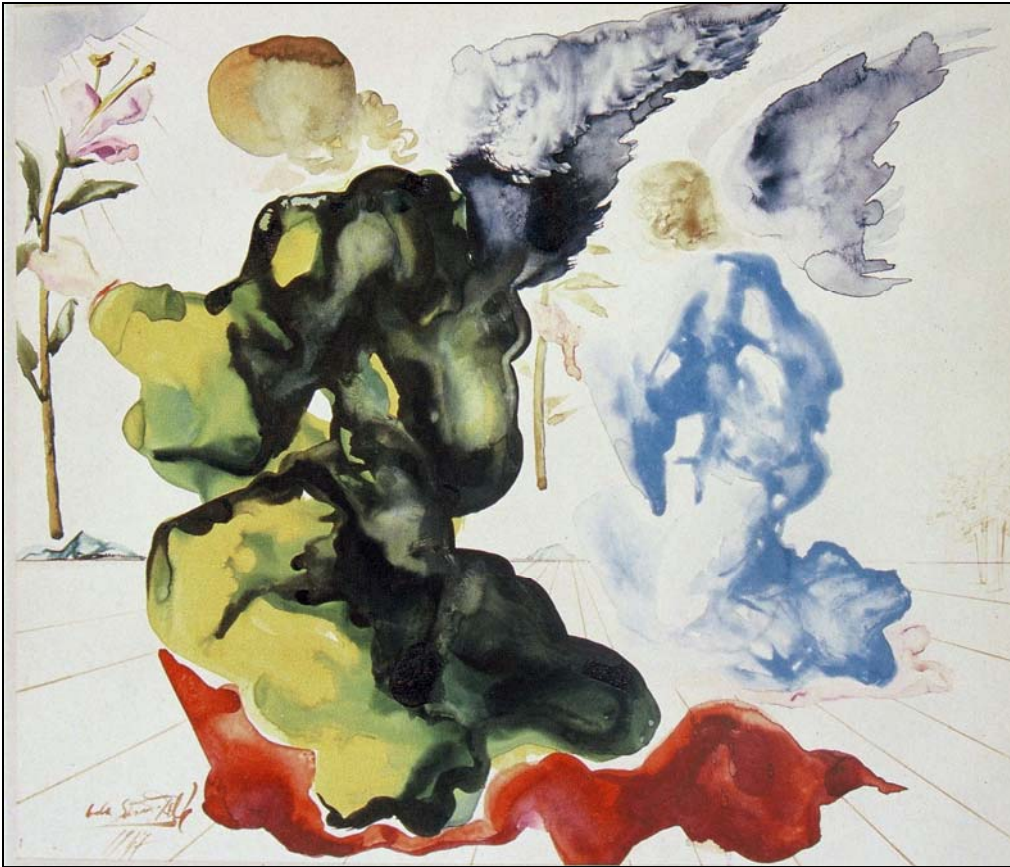
Image 7 : Salvador Dali (1904-1989) Aquarelle (collection privée)

Comparaison avec l'annonce à Joseph : En prolongement, on lit le passage de l'Évangile de Matthieu où Gabriel vient annoncer la naissance de Jésus à Joseph (Mt 1, 18-25). Visite, annonce, songe, rêve (sur le rôle du rêve dans la tradition littéraire, on évoque le songe d'Athalie et le rêve de Livie dans Cinna ), don du nom à l'enfant.