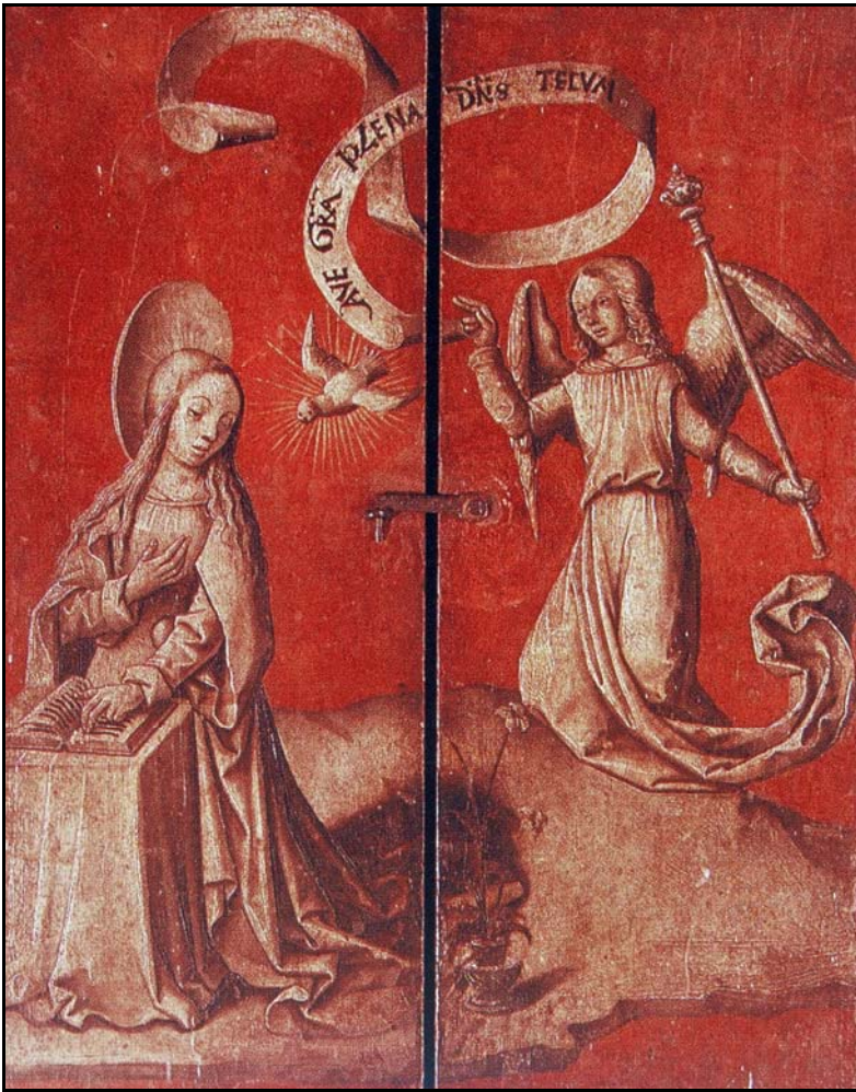
Image 9 : Maître de Moulins actif de 1480 à 1500, Retable des Bourbons (volets fermés), cathédrale de Moulins (Allier)

Conclusion : Ce travail sur l'Annonciation permet de mettre en évidence et d'analyser les rapports entre l'écriture, la parole et l'image, rapports essentiels pour l'intelligence des textes et l'appréhension de la création littéraire.