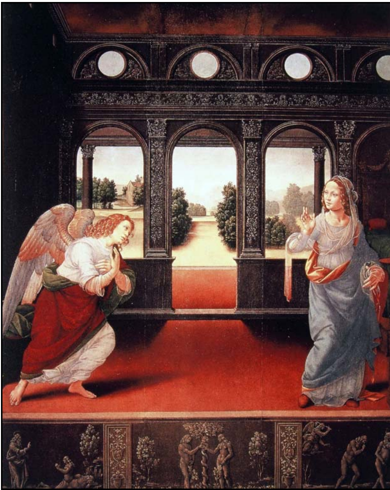
Image 3 : Lorenzo di Credi (1459-1537). Florence, Musée des Offices

Il apparaît au terme du visionnage que toutes les images sont à la fois semblables et différentes.