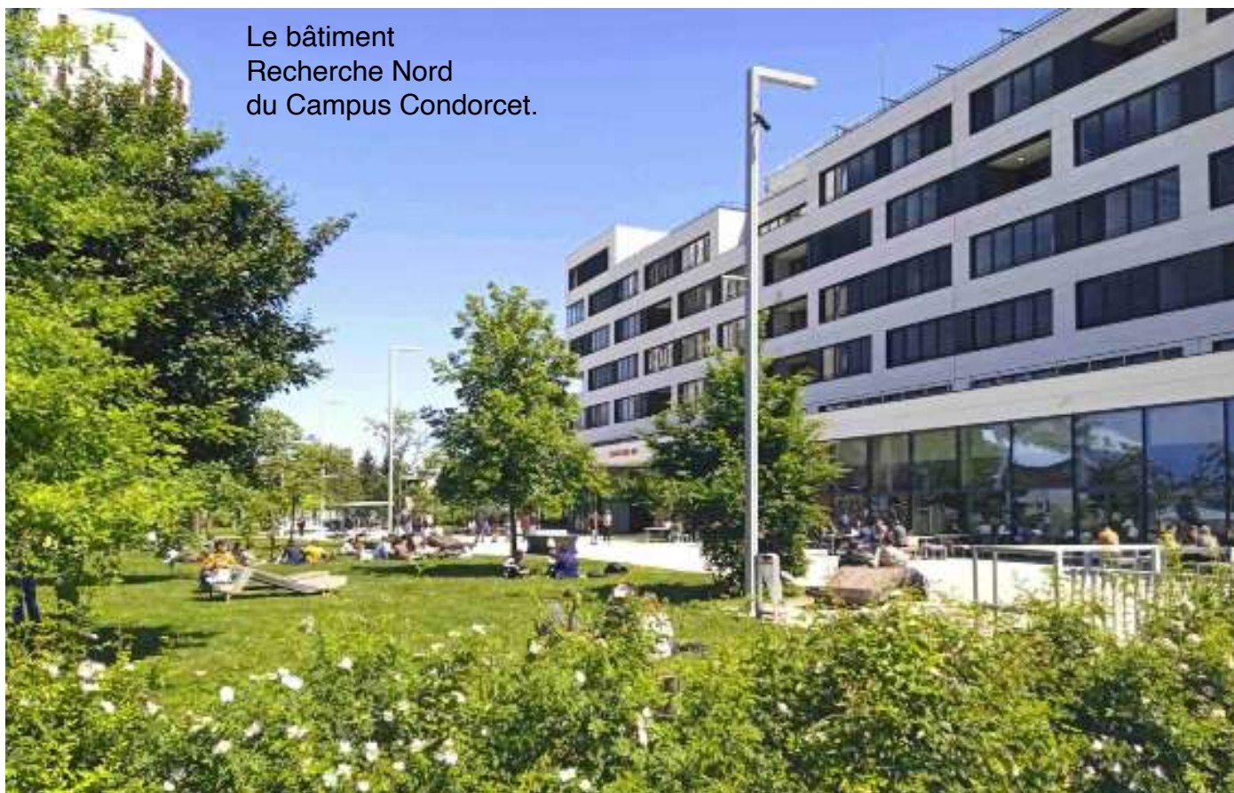
Le bâtiment Recherche Nord du Campus Condorcet.