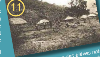
Maison des élèves natas (catéchistes) à Houailou, Nouvelle Calédonie

Lundis 29 avril et 6 mai Filmer l'islam d'hier et de demain Jamal Ahabab / IREL, EPHE-PSL