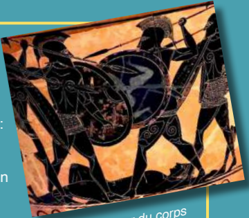
Bataille autour du corps d'un héros mort, probablement Patrocle (Cratère de Pharsale, vers -530, Musée archéologique d'Athènes)

Mercredi 10 janvier 10h-13h : Y a-t-il des guerres de religion ? Philippe Gaudin / IREL, EPHE-PSL 14h-17h : Des combats bibliques aux batailles de Tsahal : réflexion sur le judaïsme et l'éthique de la guerre Stéphanie Laithier / IREL, EPHE-PSL