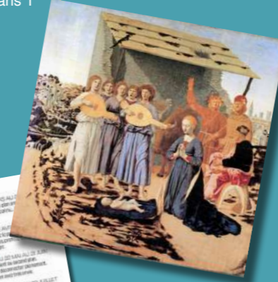
Nativité (Piero della Francesca, Florence, 1460-1475, National Gallery, Londres)

Décembre 2023 Le cycle abordera cette année trois grands moments de la Nativité à la Passion afin de mettre en lumière la vision qu'en ont donné les peintres à travers les siècles. L'évolution de ces représentations traduit les différentes interprétations de ces épisodes et la manière dont ils s'inscrivent dans l'imaginaire visuel jusqu'à l'époque contemporaine.