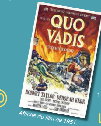
Affiche du film de 1951.