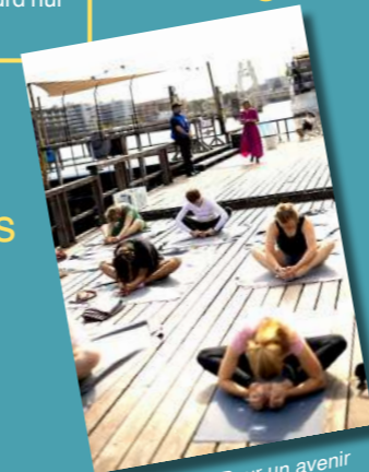
Atelier yoga 'Pour un avenir incarné' lors d'un festival à Berlin en 2023

Mars à mai 2024 Par quelles voies bouddhisme, hindouisme et taoïsme sont-ils arrivés en Occident, et en France en particulier, depuis le 19 e et surtout le 20 e siècle ? Ce cycle à plusieurs voix permettra de suivre les étapes et les manifestations de cette implantation des religions asiatiques à travers leurs textes ou à travers leurs pratiques.