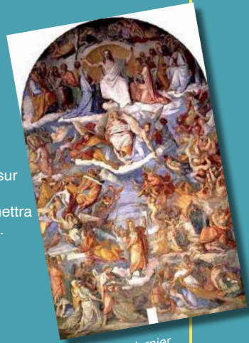
Le jugement dernier (Peter von Cornelius, Munich, 1836-1839).