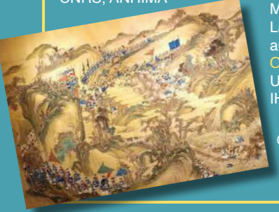
Capture du général taïping dissident Shi Dakai par les troupes impériales le 13 juin 1863