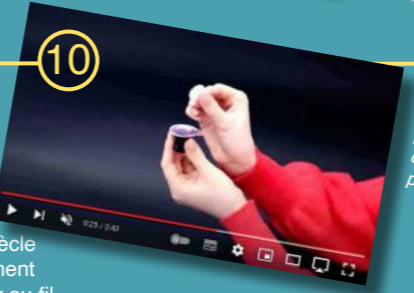
Vidéo de démonstration pour ouvrir une double dose de communion pré-remplie en 2020.