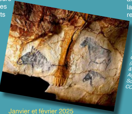
Restitution du panneau de la grotte Cosquer.