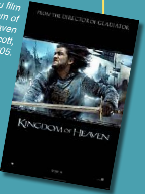
Affiche du film Kingdom of Heaven de Ridley Scott, en 2005.