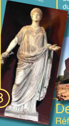
Statue d'Agrippina sous les traits de Cérès.

Mars et avril 2025 Apparus dans le contexte spirituel foisonnant de l'Inde du 5 e siècle avant notre ère, le bouddhisme et l'art auquel il a progressivement donné naissance n'ont cessé de s'enrichir et de se transformer au fil de leur expansion. Des premiers édifices dont le décor élude l'image du Bouddha à l'essor d'une iconographie parfois étonnante, nous nous sommes aussi à la rencontre de quelques hauts lieux de l'art bouddhique.