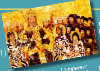
L'empereur Jean VI Cantacuzène président le synode de 1351.

Novembre et décembre 2024 L'orthodoxie est souvent abordée au travers de sa théologie, ses rites, ses pratiques, sa spiritualité – en somme, tout ce qui en fait un christianisme un peu exotique. En revanche, l'histoire des Églises orthodoxes est mal connue. Ce cycle a pour but de présenter la constitution et les transformations des Églises orthodoxes pour comprendre leur rôle dans l'histoire du monde orthodoxe. Cette première partie, qui va jusqu'au 15 e siècle, est dominée par l'Église byzantine et le patriarcat de Constantinople : c'est un moment important pour la constitution des Églises orthodoxes.