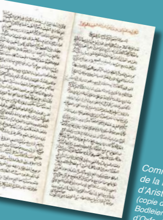
Commentaire de la Métaphysique d'Aristote par Al-Farabi (copie de 1630, Bibliothèque Bodleienne, Université d'Oxford, CC BY 4.0).

Janvier 2025 Ce cycle abordera trois moments-clés de la philosophie islamique à l'époque classique : le moment fondateur des traductions gréco-arabes qui a eu lieu à Bagdad aux 9 e et 10 e siècles, celui d'al-Ghazali qui prolonge et critique l'héritage avicennien tout en questionnant l'ensemble des sciences de son temps, et celui de l'Andalou Averroès qui reprend l'héritage d'Aristote et s'attache à définir sa place au sein de la société. À travers ces trois moments qui parcourent la totalité de l'époque classique, on tentera de définir les contours de la rationalité en Islam et le rôle que les philosophes et les théologiens lui ont accordé dans leurs différents projets intellectuels.