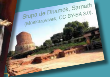
Stupa de Dhamek, Sarnath.