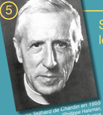
Pierre Teilhard de Chardin en 1955 (Philippe Halsman, Archives des jésuites de France, CC BY-SA 3.0).

Mardis 7, 14 et 21 janvier Ziad Bou Akl / EPHE-PSL, LEM