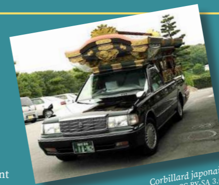
Corbillard japonais