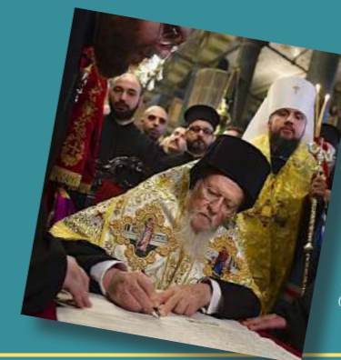
À gauche, le patriarche de Constantinople Bartholomeos signant le décret d'autocéphalie de l'Église d'Ukraine en 2019. Ci-dessus, le patriarche de Moscou Kirill lors d'une rencontre avec le nonce apostolique le 3 mars 2022, une semaine après le début de la guerre russe contre l'Ukraine.