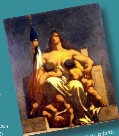
La République nourrit ses enfants et les instruit (Honoré Daumier, 1848, Musée d'Orsay, Paris)

10h-13h : Laïcité française. Controverses contemporaines Philippe Portier / EPHE-PSL, GSRL 14h-17h : La laïcité en France aujourd'hui : quels enjeux philosophiques ? Philippe Gaudin / IREL, EPHE-PSL