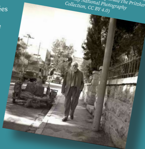
Martin Buber en Israël en 1962