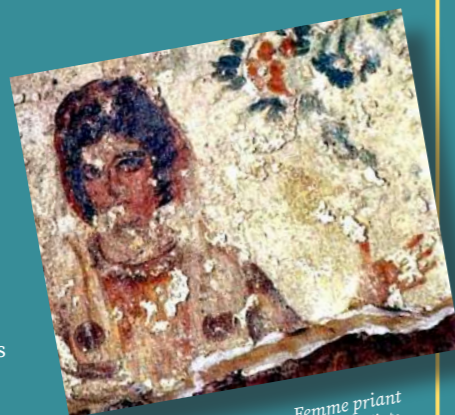
Femme priant (Catacombe de Calixte, Rome, début du 4 e siècle)

Anna Van den Kerchove / IPT Valérie Nicolet / IPT