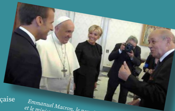
Emmanuel Macron, le pape François, Brigitte Macron et le ministre des Affaires étrangères Jean-Yves Le Drian lors de la visite au Vatican le 26 juin 2018

Jedi 6 octobre La République laïque et la continuité de la diplomatie française