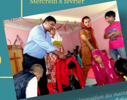
Imposition des mains dans une Église népalaise